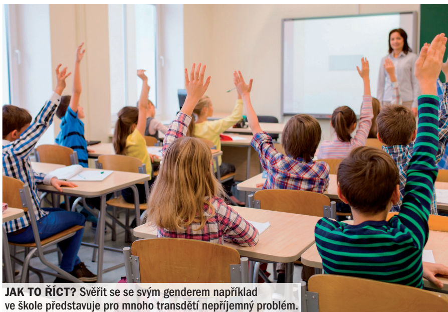
JAK TO ŘÍCT? Svěřit se se svým genderem například ve škole představuje pro mnoho transdětí nepříjemný problém.

situaci ve vztahu ke svému genderu je daleko složitější – na rozdíl třeba od zemí, kde se mluví anglicky a kde se rod vyjadřuje jen občas, třeba v zájmech nebo označeních osob,“ upřesňuje sociolog.